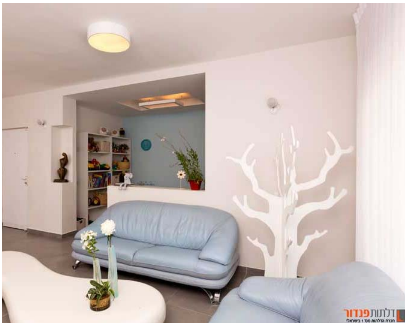
דלתות: לכל העסקים ובעלי המקצוע

כדי להעצים את פינת הסלון ולהעניק לו מראה "ארוך" יותר נמתחו לאורך הפינה שני פסים אפורים שמתחילים בטלויזיה ומסתיימים במטבח. כדי לתת עוד תחושה של גודל ומקום לדיירי הבית הוחלט לצאת מהשבלונה המוכרת של הצבת מזנון מתחת לטלויזיה והממירים הלא מחמיאים מוקמו מאחורי הקיר, כאשר רק עינית קטנה שמתחברת לכולם הוצבה מקדימה.