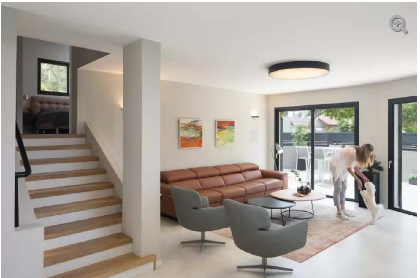
מפתחים גדולים להכנסה מרבית של אור