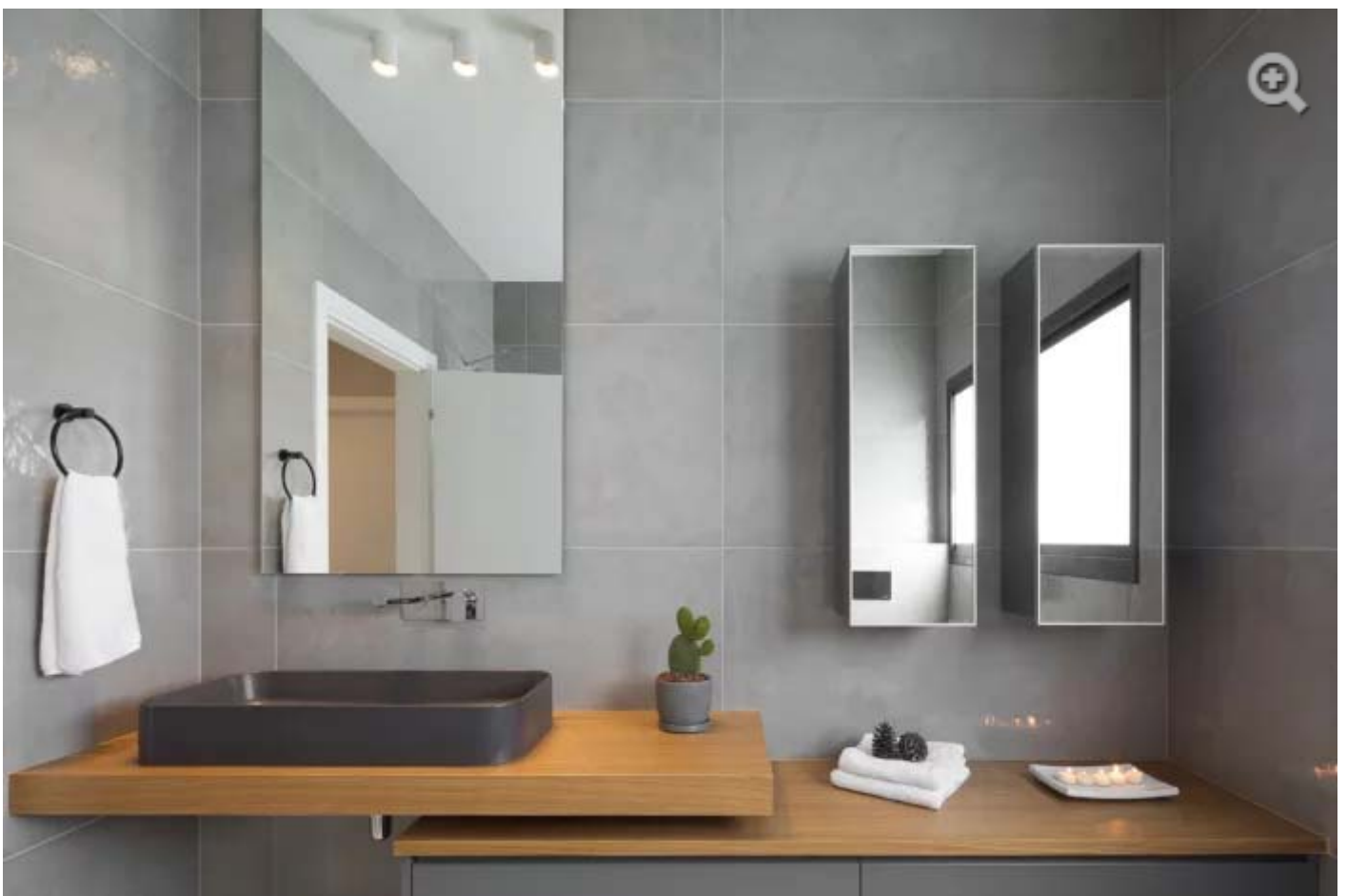
באחד מחדרי הרחצה יצירתיות שיא בבחירת החומרים וארגונם