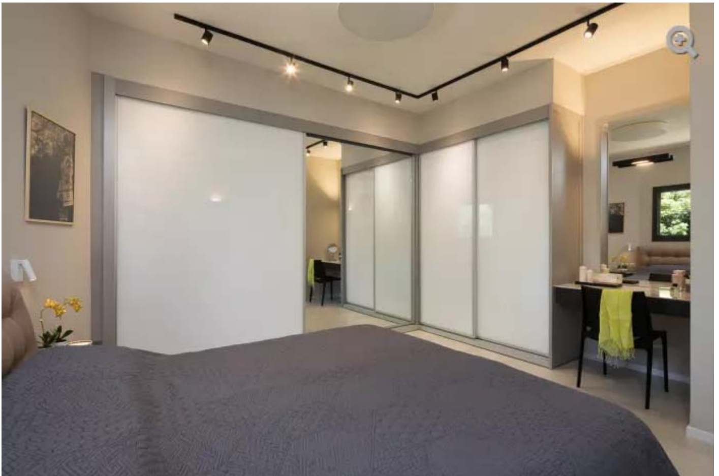
תאורה ממוקדת לצד תאורת אווירה בסוויטת שינה