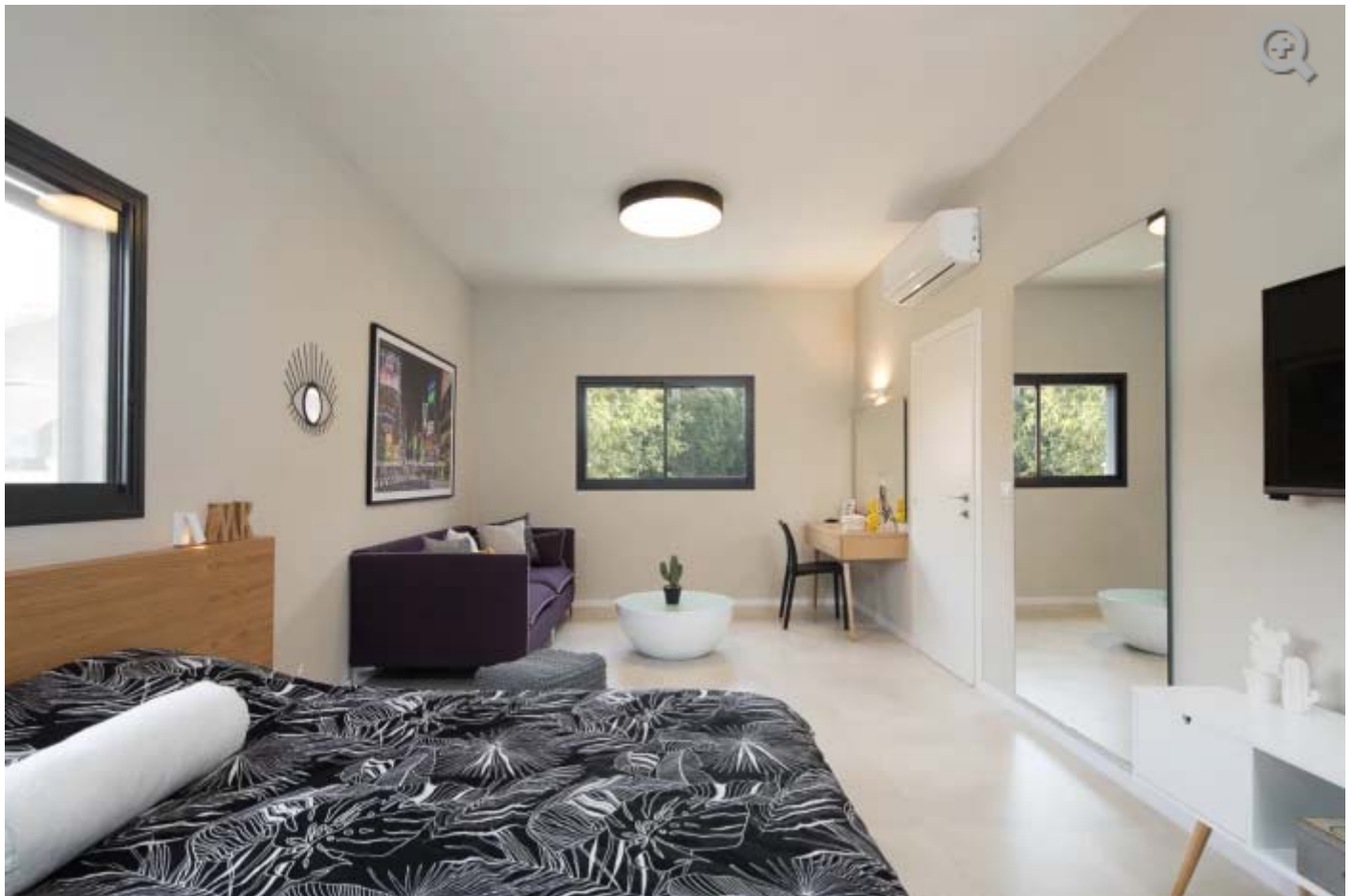
הילדים יכולים אפילו לארח בחדרם