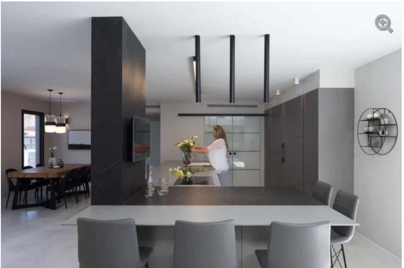
מטבח מושלם עם משטחי עבודה נוחים

חדרי השירותים של האורחים עוצבו אף הם במינימליזם מוקפד בשיק יפני. בוצ'ר עץ גדול ומעליו כיור מיניאטורי וברז שיווד מלמעלה ישירות לכיור. "המשכנו את הגוונים של לבן, שחור ואפור בכל הבית כדי לשמור על אחדות עיצובית ועל מראה נקי ורגוע. התאורה מגיעה בצורה יפנית הוליסטית של הילה סביב האריח", אומרת צלקה.