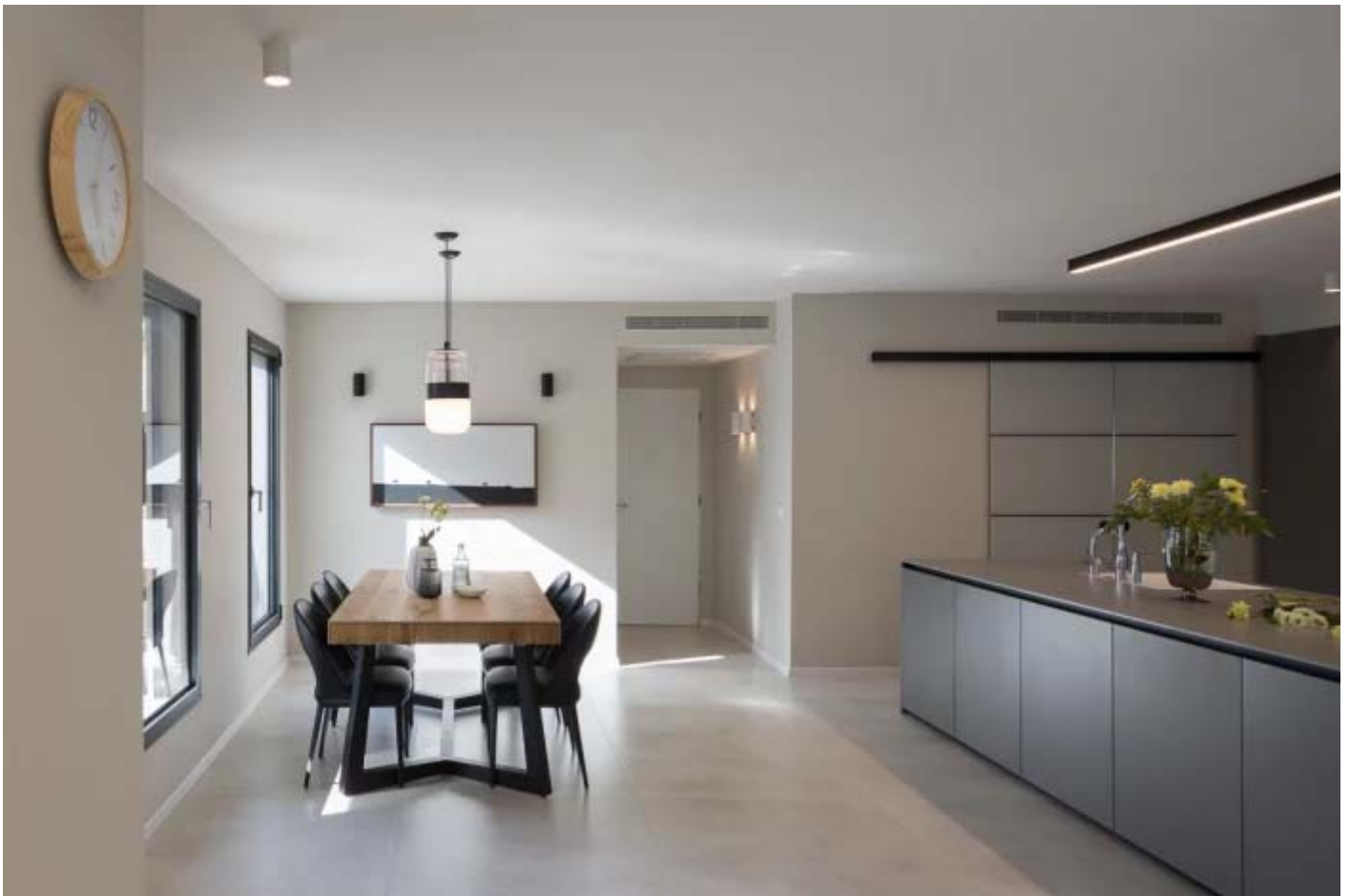
פינת אוכל סמוכה למטבח