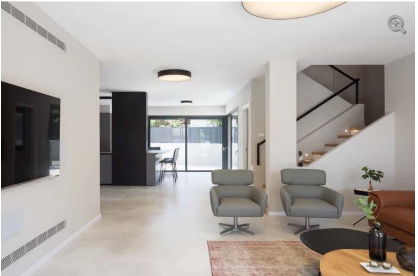
מבט מהסלון לעבר המטבח

לפרויקטים נוספים של מעצבת הפנים ענבל צלקה - כנסו לכאן