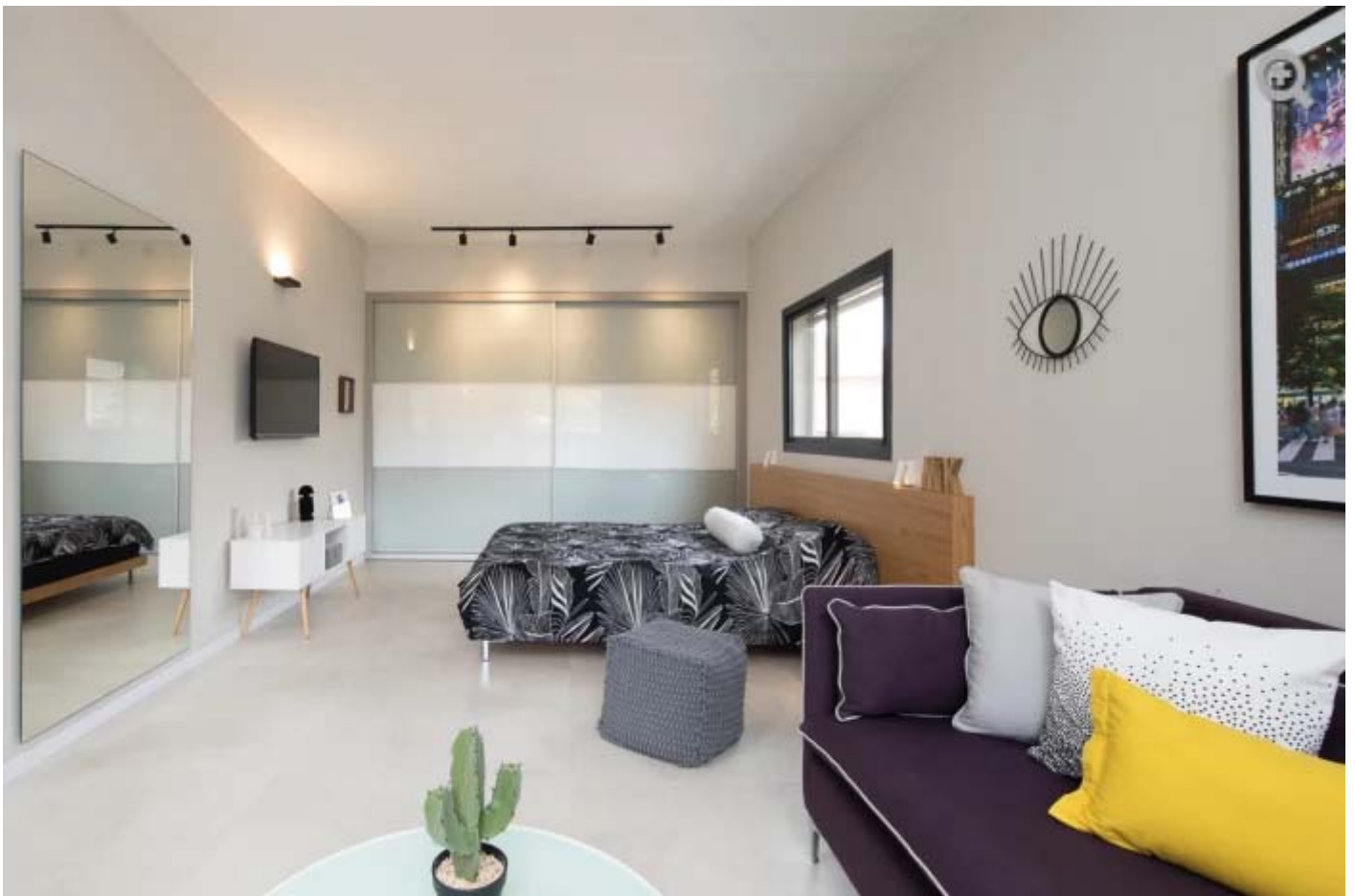
אחת מסוויטות השינה

בתהליך העיצוב הותאם הבית לחלומה של בעלת הבית במטבח ענק ומצויד היטב. "המטבח הרחב מאפשר חוויית בישול ואירוח משודרגת ומציע שמירה על קשר עין עם מוקדים שונים בבית. כמו כן, יצרנו מזווה גדול ושפע של פתרונות אחסון סמויים בחיפוי של דלתות עשויות מזכוכית לבנה וכן, תאורת עבודה ותאורה ממוקדת. עמוד שפגע בזרימה של החלל הוסב לאלמנט ויזואלי מעניין המחופה בדקטון שחור דרמטי היורד לחיפוי משטח הישיבה וגם משמש כמתקן לטלוויזיה במטבח.